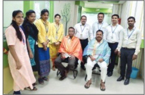
Karimnagar Branch (Telangana)