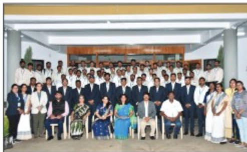
▶ Yavatmal Region