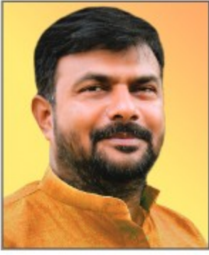
Hon. Hemant Shriram Patil Founder and MP