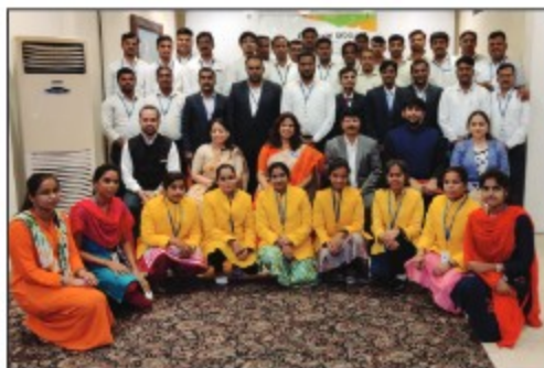
▶ Hyderabad Region