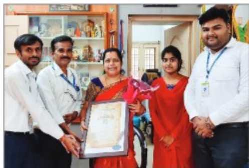
► Hospet Branch (Karnataka)