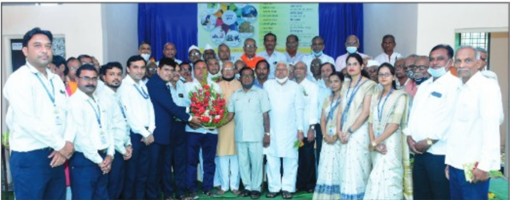
▶ Darwha Branch