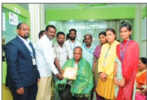
◀ Sultanabad Branch (Telangana)