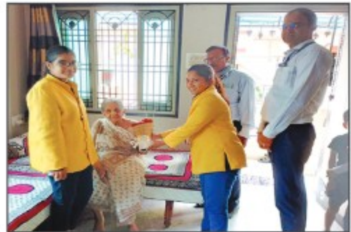
▶ Surat Branch (Gujarat)