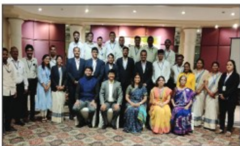
▶ Nagpur Region