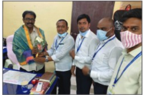
▶ Sircilla Branch (Telangana)