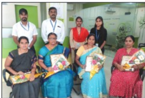
► Rajahmundry Branch (Andhra Pradesh)