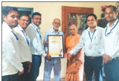
► Main Line Yavatmal Branch - 2