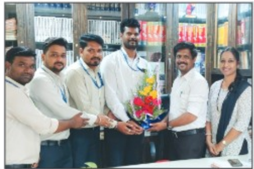
▶ Dhanki Branch