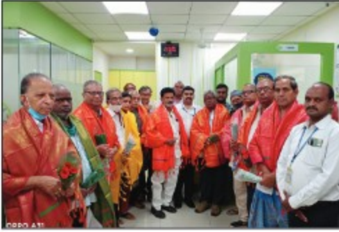
Vijayawada Branch - I (Andhra Pradesh)