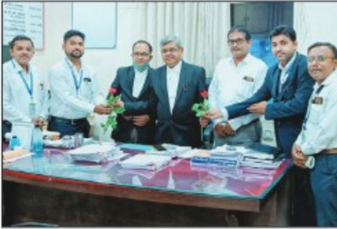
▶ Nanded City Branches