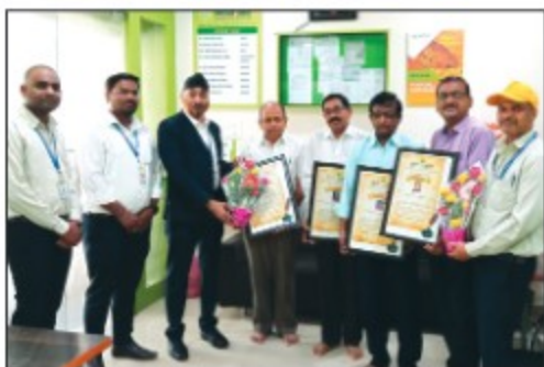
► Kinwat Branch