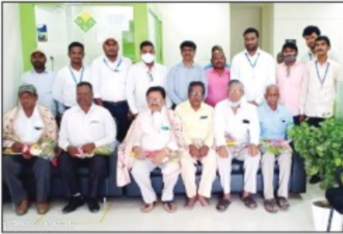
Bodhan Branch (Telangana)