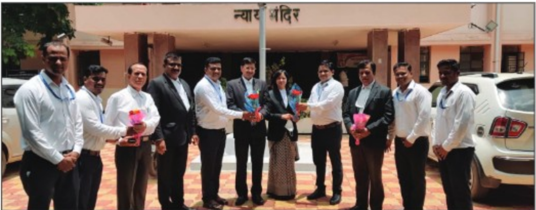
▶ Datta Chowk Yavatmal Branch-1