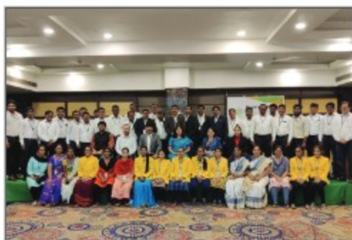
▶ Vijayawada Region (Andhra Pradesh)