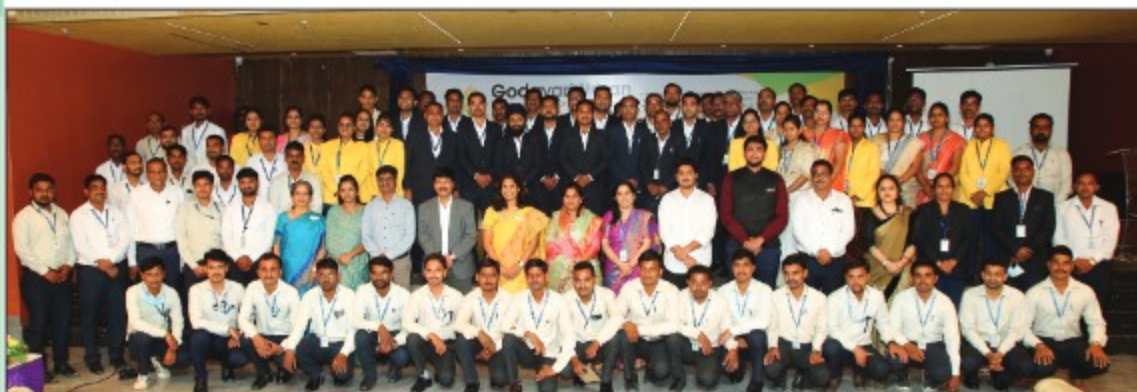
▶ Marathwada Region