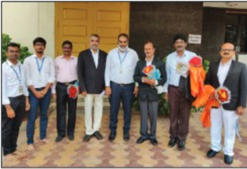
▶ Hyderabad Branch