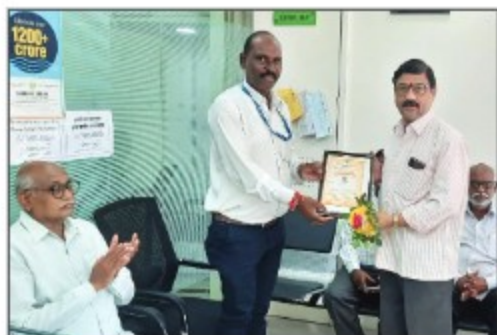
► Pandharkawada Branch